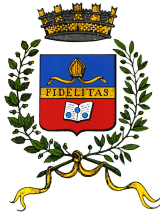
Comune di Soriano nel Cimino