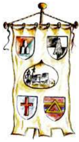
Ente Sagra delle Castagne