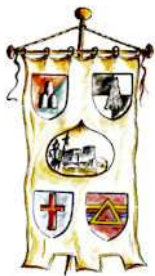
Ente Sagra delle Castagne